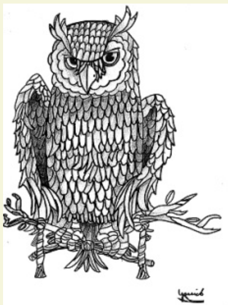
Yannick (17 jaar)