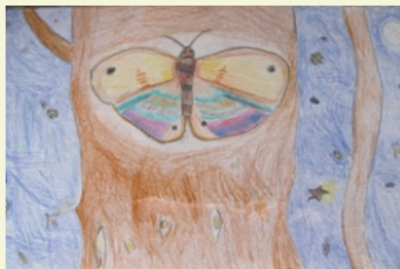
Jade Vanden Breen (13 jaar)